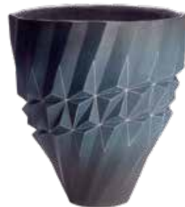
【陶艺】内田和秀(岛根县松江市) 《继续几何文壶广口花器》 ※第68届展出品

此次展览将展出通过严格审查评选的 7 种工艺的作品,分别是陶艺·染织·漆器工艺·金属工艺·木竹工艺·人偶·其他工艺 7 种工艺的作品。以文化遗产传承人的作品为首,展出约 300 件能够展现创作者高超技艺及追求独创表现的获奖作品、住在山阴地区工匠人的入选作品等。