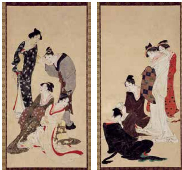
葛饰北斋《妇女风俗图》1792-94(宽政4-6)年左右 岛根县立美术馆藏(永田收藏品)

本展览会将从北斋研究者永田生慈先生(1951-2018)捐赠给岛根县的“永田收藏品”中,着重挑选北斋“春朗期”和“宗理期”(20 虚岁到 45 岁左右)的作品进行展示。通过约 300 件作品、资料(包括极其稀少的春朗期亲笔画、宗理期的一级版画作品——《津和野藩传来摺物》(首次在岛根公开展示全部 118 件)),观众可以看到年轻时北斋的钻研精神和挑战的轨迹。