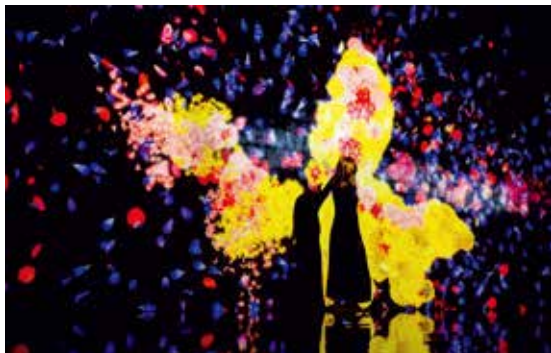
与花卉一起生活的动物们Ⅱ

“teamLab 学习! 未来的游乐园”是艺术团队 teamLab 推出的一个以共同创造性“共创”为理念的教育项目,日本国内外累计到场人数达到了 1000 万人,在全世界持续受到关注。