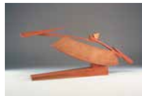
澄川喜一《そのあるかたち97-1》1997(平成9)年

「水を画題とする絵画」をゆったりと鑑賞いただけるよう「水辺の展示室」を新設。また、当館が誇る北斎コレクションを常時30点程度入れ替えながらご覧いただけるよう、展示室2を「北斎展示室」としてリニューアルしました。