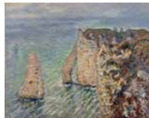
クロード・モネ《アヴァルの門》1886年