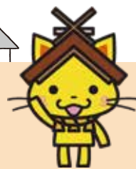
島根県観光キャラクター 「しまねっこ」 鳥取県鳥取市7035号

期間 6月1日(水)、2日(木)、3日(金) 10:00~ 場所 コレクション展受付