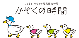
新イメージキャラクター

子供たちにとって美術の楽しさ、芸術の喜びを分かちあえる場所となるよう、毎日午前中「かぞくの時間」を実施します。また、こっころカード(アプリ)でのサービスも拡大します。