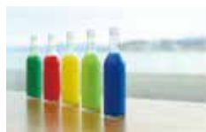
「色水あそび」※イメージ

毎月第3日曜日のしまね家庭の日にあわせ造形ワークショップをスタート(島根大学教育学部川路澄人教授企画・監修)。詳しくは美術館ホームページをご確認ください。