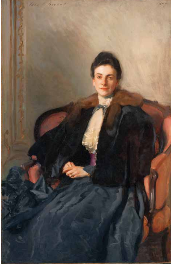
ジョン・シンガー・サージेंट《ハロルド・ウィルソン夫人》1897年 東京富士美術館蔵 ※3月16日まで展示