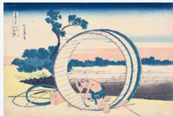
葛飾北斎《富士三十六景 尾州不二見原》[新庄コレクション] 1830~34(天保初期)頃

巨大な円形の樽を通して小さな三角形の富士を見せる趣向が面白いシリーズ中の人気作。