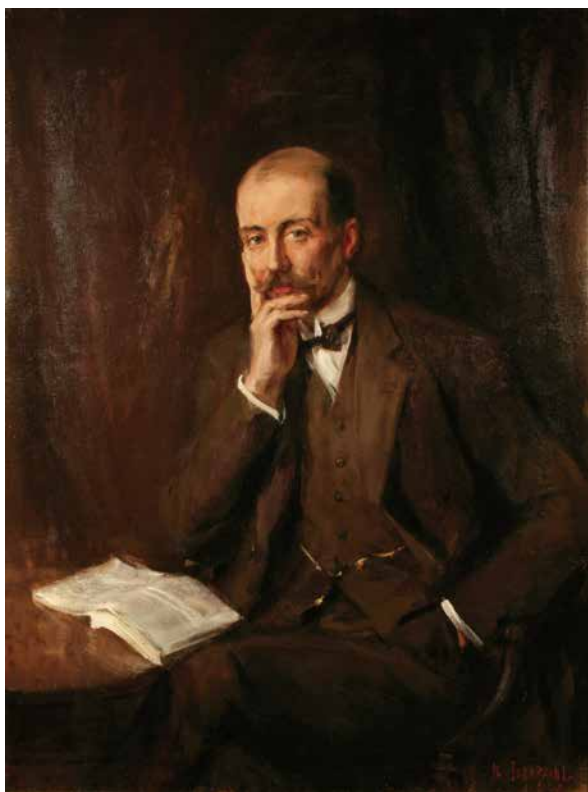
《エイドリアン・ボールト肖像》1923年 英国王立音楽大学蔵 (On loan from the Royal College of Music)