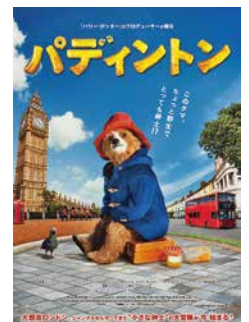
© 2014 STUDIOCANAL S.A. TF1 FILMS PRODUCTION S.A.S. PADDINGTON BEAR™, PADDINGTON™ AND PB™ ARE TRADEMARKS OF PADDINGTON AND COMPANY LIMITED www.paddington.com