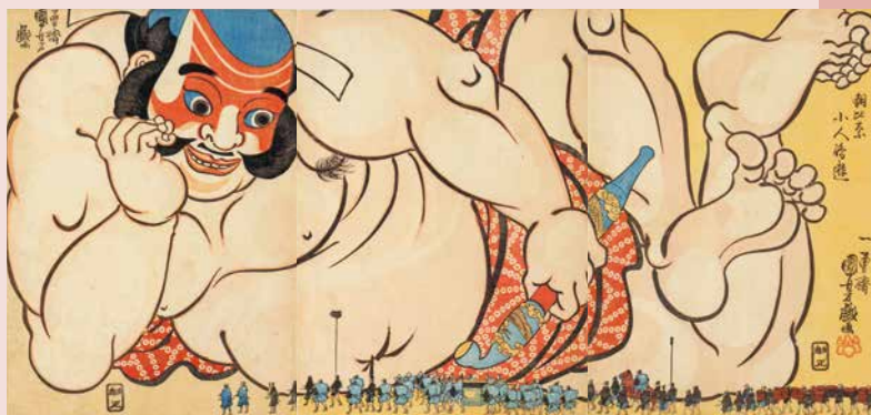
歌川国芳《朝比奈小入嶋遊》1847年頃

江戸時代後期に活躍した浮世絵師・歌川国芳。豪快な武者絵をはじめ、伝説の妖怪や怪物、趣向を凝らした戯画など、多彩な作品 220 点により奇想天外な国芳ワールドを紹介します。