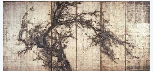
山本梅逸《墨梅図》(左隻)1819(文政2)年頃

当館が所蔵する江戸時代の近世絵画、近代以降の日本画より、特に当館が誇る優品、島根県出身や来遊画家の作品など、島根ゆかりの美術を紹介します。