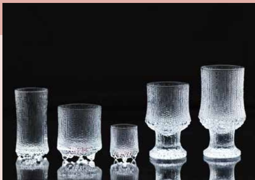
タピオ・ヴィルカラ《ウルティマ・ツレ(ドリンクング・グラスのセット)》1968年 Tapio Wirkkala Rut Bryk Foundation Collection / EMMA – Espoo Museum of Modern Art.