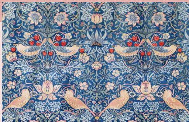
ウィリアム・モリス《いちご泥棒》1883年

北欧モダンデザインの巨匠タピオ・ヴィルカラ(1915-1985)。本展はヴィルカラ生誕110年と没後40年を記念して企画された日本初回顧展で、全国4会場を巡回するものです。