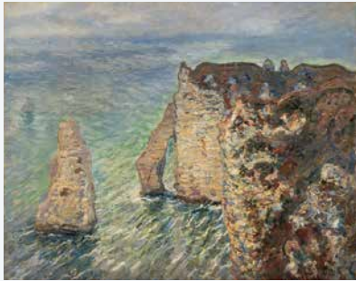
クロード・モネ《アヴァルの門》1886年