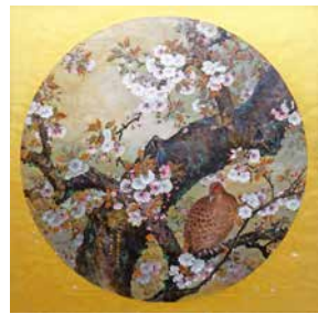
上/《桜にヤマドリ》1905年 個人蔵(英国) 下/《スタディ》1924年 島根県立美術館蔵