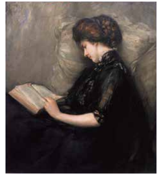
石橋和訓《美人読詩》1906年