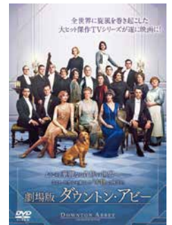
(C) 2019 Universal Studios. All Rights Reserved. Downton(TM) and Downton Abbey(R) (C)2019 Carnival Film And Television Limited.