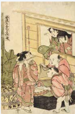
葛飾北斎《風流五節子供遊》[永田コレクション] 1787~90(天明末~寛政初期)