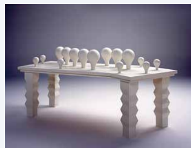
建畠寛造《BALLOON 5 (LANDSCAPE)》1997(平成9)年