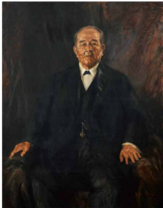
《渋沢栄一肖像》1925年 学校法人日本女子大学蔵