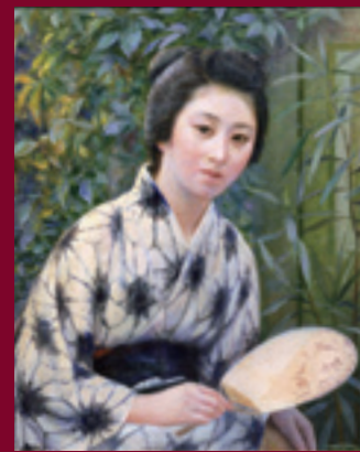
5 岡田三郎助《五葉菫》1909(明治42)年