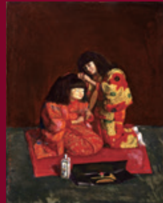
3 岸田劉生《二人麗子図(童女髻髪図)》1922(大正11)年