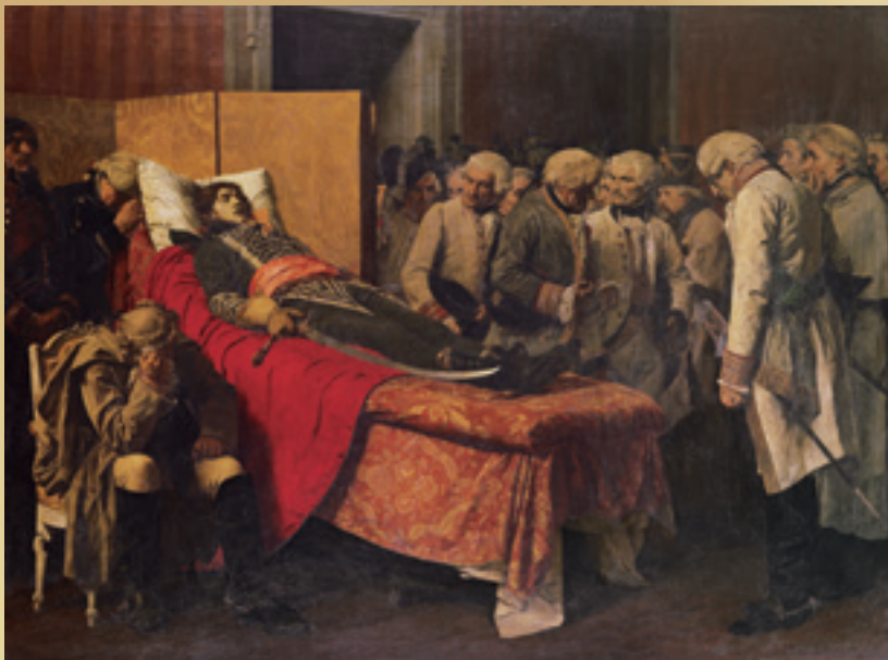
1 ジャン=ポール・ローランス(マルソー将軍の遺体の前のオーストリアの参謀たち)1877年