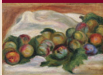
4 オーギュスト・ルノワール《静物(ブラム)》1905年頃