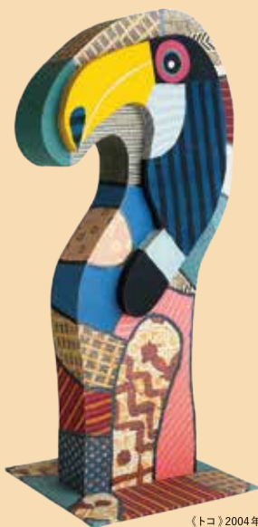
《トコ》2004年 神奈川県立近代美術館蔵