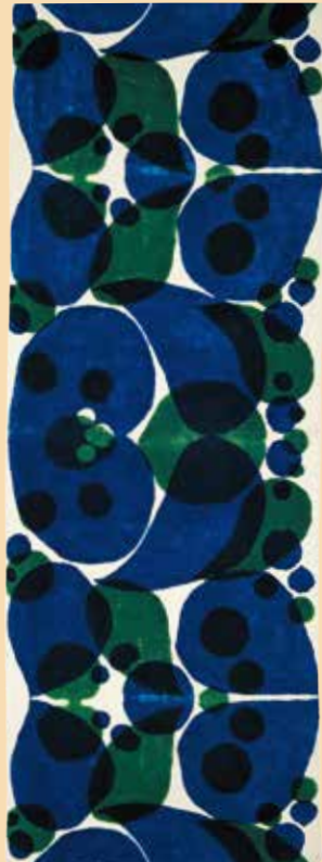
《注染水玉文布(部分) 1950年代 日本民藝館蔵

「リーチ・ポタリー-1952 陶芸家バーナード・リーチの工房」 日時：4月27日(日)・5月11日(日) 10:30-14:00-(本編33分+特典映像36分) 会場：ホール (190席当日先着順/各回30分前開場) ※鑑賞無料