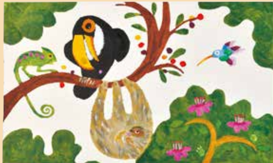
《『トコとグーグーとキキ』絵本原画 2004年 公益財団法人 泉美術館蔵