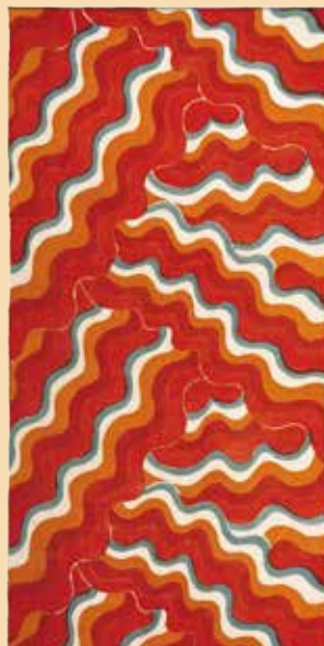
《型染うねうね文布 1981年 学校法人女子美術大学蔵