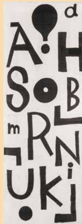
《型染布 2018》 2018年 個人蔵

惜しまれつつも、2024年に101歳の生涯を閉じた、東京出身の染色家、 ゆのき さみろう 柚木沙弥郎 (1922-2024)。戦後、 やなぎむねよし 柳宗悦らが提唱した民藝思想に触れ、 みんげい 芹沢銈介のもとで染色家としての道を歩みはじめます。色彩豊かで、のびのびと自由で大胆、ときにユーモラスな染色作品が生み出されました。その創作世界は版画やコラージュ、絵本、立体作品などの分野にまで広がっています。本展では、作家の長年にわたる多彩な活動を概観するとともに、最晩年の仕事となる新作もご紹介します。さらには、島根をはじめとする作家とゆかりの深い国内外の各都市をテーマにした特別展示も行います。100歳を超えてなお、人生を愛し、楽しんだ、柚木沙弥郎の75年にわたる創作活動の全貌をご堪能ください。