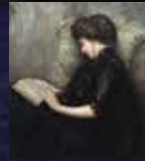
石橋和訓〈美人読詩〉 1室展示: 8/5(水)~1/4(月)