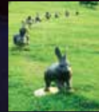
谷内佐斗司 〈宍道湖うさぎ〉 常時屋外展示