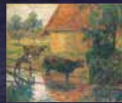
ポール・ゴーギャン〈水飼い場〉 1室展示:8/5(水)~1/4(月) 1/6(水)~5/5(水・祝)